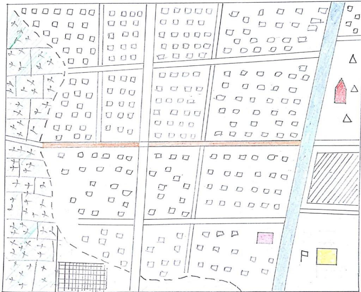
ရွာခိုင်ကြီး(မြောက်)ကျေးရွာ သယံဇာတပြမြေပုံ